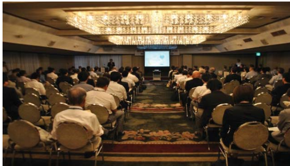
～ I 部：活動報告の様子 ～