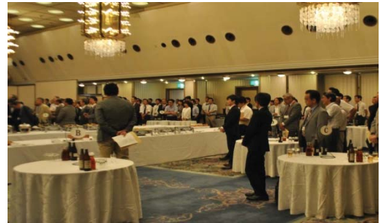
～ II 部：懇親会の様子 ～