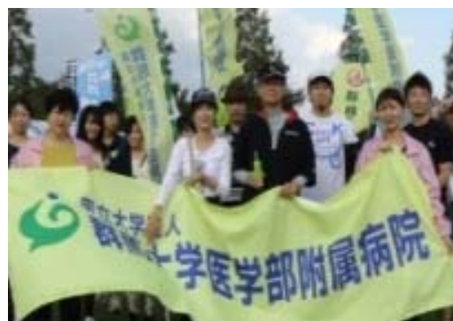
＜群大病院リレーウォーク＞ 病院長も看護部長もみんな一緒に、歩きました