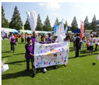
＜いのちつなぐ、リレーウォーク＞ サバイバーズフラッグを持って歩きました