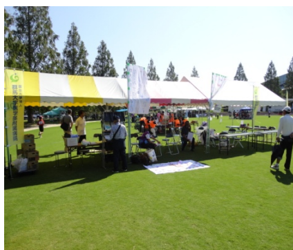
＜群大病院の職員と一緒にのテント＞ リラクゼーションマッサージを受け交流 もはかれました